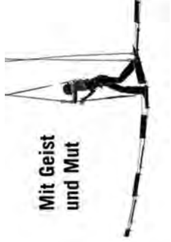
Mit Geist und Mut

Jeweils kurz nach Jahresbeginn versammeln sich Tausende von Christinnen und Christen zu gemeinsamen Gebetszeiten an ihrem Wohnort oder in ihrer Region. Die jährliche Allianzgebetswoche im Januar ist eine lebendige Tradition – in Deutschland, in ganz Europa und weltweit. Das Zusammenkommen aus verschiedenen Verbänden, Landes- und Freikirchen zum Gebet ist ein