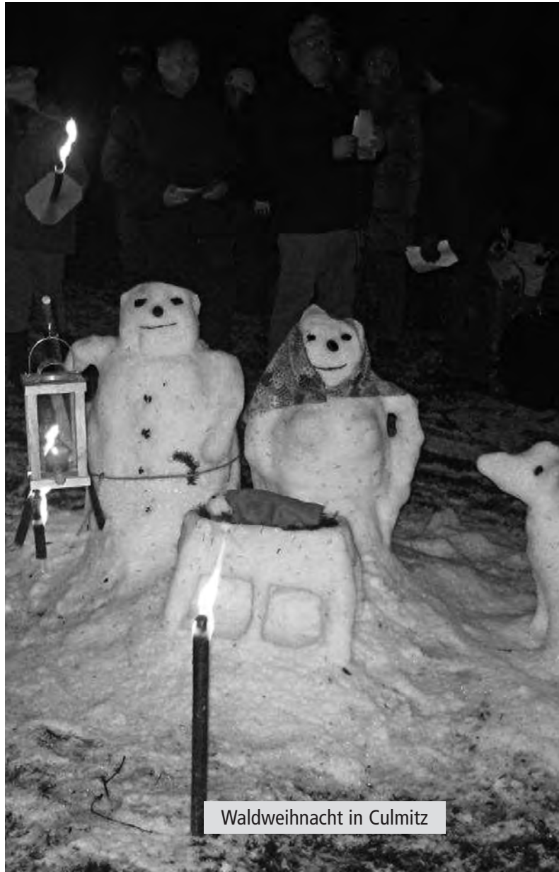
Waldweihnacht in Culmitz