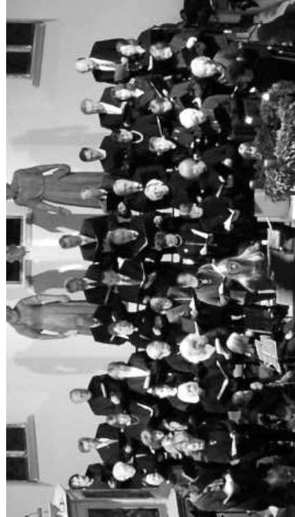
Festliche Klänge in unserer Stadtkirche zur Adventszeit und zum Jahreswechsel