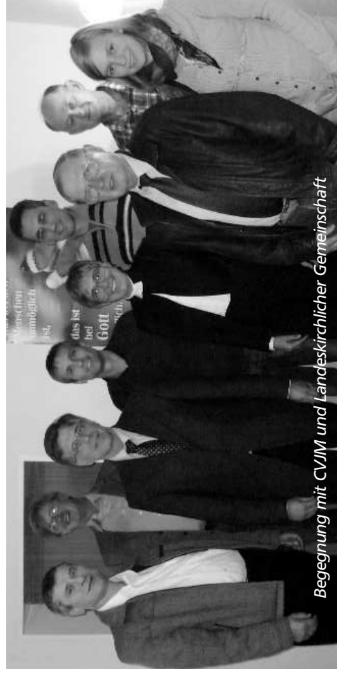
Begegnung mit CVJM und Landeskirchlicher Gemeinschaft

Das gute Miteinander zwischen der Stadt Naila und der Kirchengemeinde zeigt sich in der Kooperation im Bereich der Kindertagesstätten. Die Suche nach einem neuen Standort für den „Kindergarten Am Park“ soll vorankommen.